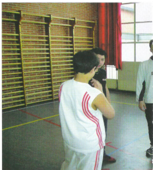
Start pas na extra uitleg

den en taken een belangrijke rol spelen bij de activiteiten die de leerling zelf onder de knie wil krijgen. Wellicht dat de niveaubeschrijving van 'gerichtheid op bewegen' en 'betrokkenheid bij de les' uit het Basisdocument VO ondersteunend kan werken bij een kindgerichte aanpak en het signaleren van zorgniveau en bij ontwikkelen naar een volgend niveau (basis, vervolg en gevorderd).