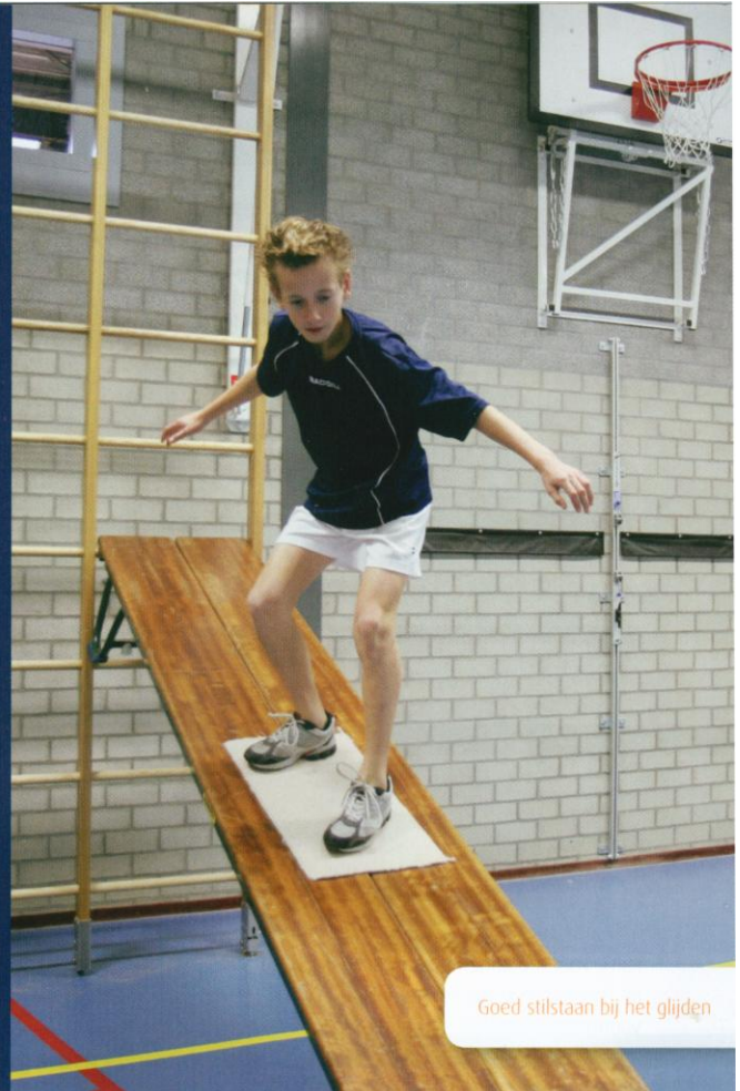
Goed stilstaan bij het glijden