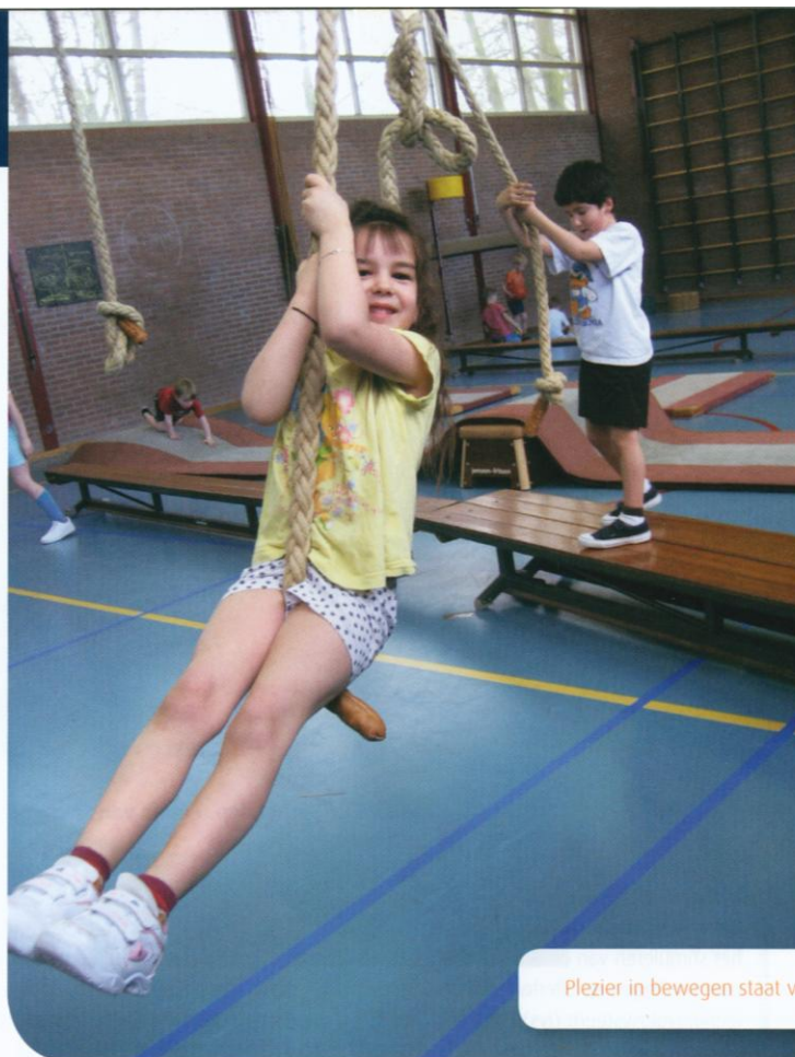
Plezier in bewegen staat voorop

Meer informatie via de websites: www.in-beweging.net tabblad LVS www.basislessen.nl www.bewegingsonderwijsonline.nl