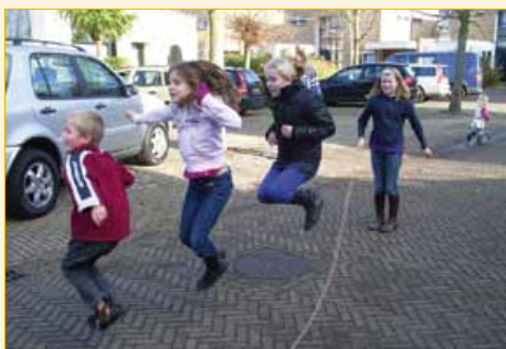
Foto 11: Veel leerlingen