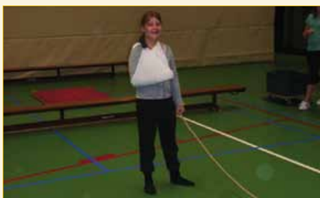
Geblesseerde leerling als draaier