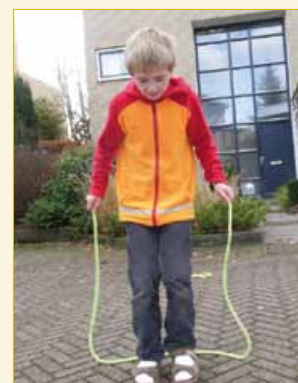
Foto 9 en 10: Als het niet lukt