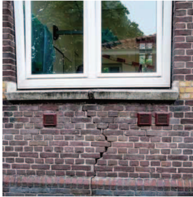
Onderhoudsbudgetten voor de buitenkant gaan rechtstreeks naar de scholen

duidelijkheid en structuur in de ruimte belangrijk, evenals overgangszones om te wennen, of de kat uit de boom te kijken.'