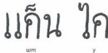
2 Thais schrift