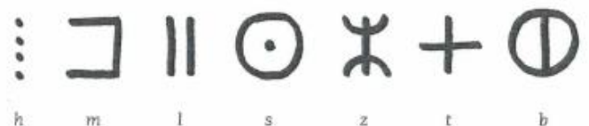
4 Berbers schrift