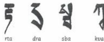
1 Tibetaans schrift

Kleine dieren helpen de hoofdfiguur in sprookjes soms. Bijvoorbeeld bij het verzamelen van graankorrels. Zij krijgen een bedankbriefje in hun eigen taal.