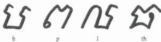
5 Cambodjaans schrift