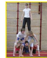
'Showen' van de grote piramide