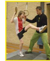
Beveiligen bij het duikelen aan de ringen met de polsgreep