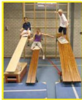
Uitdaging voor ieder kind door de verschillende niveaus