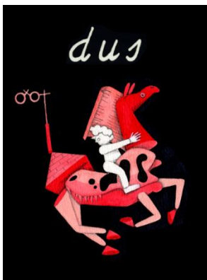
Illustratie: Cliff van Thillo (voor De Correspondent)

Daarbij: hoe makkelijker het schrijven van goede en complexe zinnen gaat, hoe eenvoudiger het wordt om een volgende stap te zetten. Het schrijven van een paragraaf bijvoorbeeld, of een klein betoog.