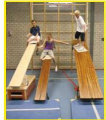
Herausforderung für jedes Kind durch die unterschiedlichen Niveaus