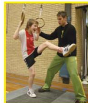
Sichern beim Purzeln an den Ringen mit dem Pulsgriff