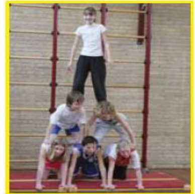
Vorführen von der großen Pyramide

Feld 4, Akrobatik – die Kinder wählen zusammen die Akrobatik formen aus indem sie überlegen mit welchen Arbeitsblättern sie arbeiten werden.