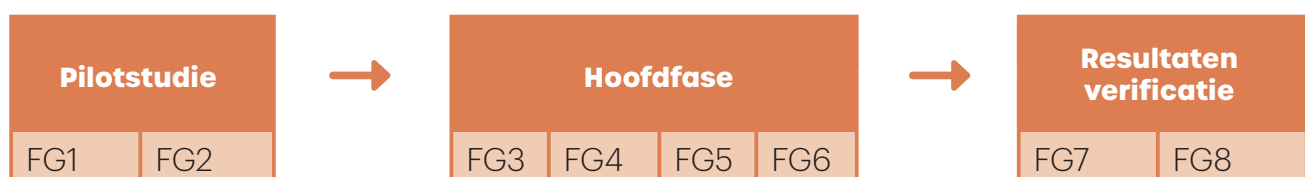
Tabel 1 Tabel 1 Kwalitatief onderzoek opgebouwd in drie fasen met verschillende focusgroepen (FG’s)

Op basis van deze achtergrond was het doel van het onderzoek om percepties van leerlingen over bewegen op het schoolplein tijdens schoolpauzes in kaart te brengen. Daarvoor hebben leerlingen uit leerjaar twee en drie van Gomarus schoolengemeenschap uit Zaltbommel deelgenomen aan een kwalitatief onderzoek. Het onderzoek bestond uit drie fasen. Verschillende